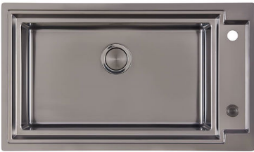
OUTLINE H25 - GUN METAL